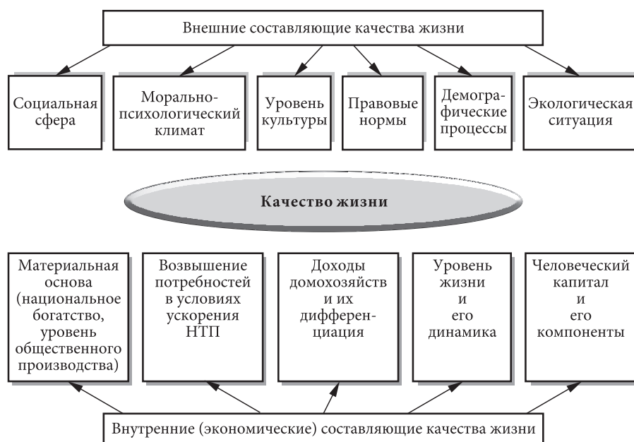
Рис. 2. Взаимосвязь внешних и внутренних составляющих качества жизни

Сегодня никто не оспаривает, что налицо огромный разрыв в доходах у населения России. 80% из них приходится на 1% населения. Россия стала одной из самых несправедливых стран в мире. Ситуация усугубляется медленным, очень медленным формированием среднего класса. Его как не было в России 25 лет назад, так нет и сейчас. Какой-то хронический, застывший на ранней стадии «пилотный проект». Отсюда эта горькая констатация: в России сегодня всего две профессии – богатые и бедные. И